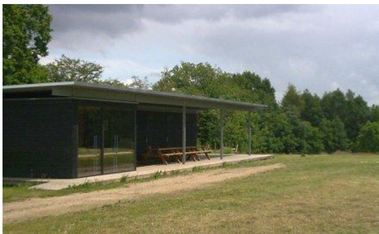
Figur 3 Råbjerghytten

Ved divisionsrådsmødet i 2003 var eneste udestående en byggetilladelse. Ansøgningen ligger til behandling i Helsingør Kommune. Desværre trak sagen igen ud. Selv om man allerede i sommeren 2004 havde fået tilsagn fra Lokale- og anlægsskuffonden og fra Friluftsrådet, så skulle man helt hen til en forårsdag i 2007, før hytten kunne indvies.