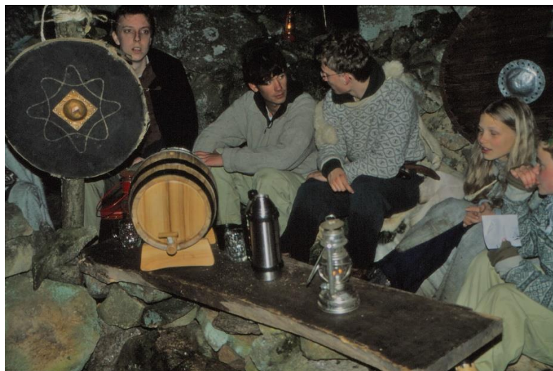
Figur 8: Forårsturnering i 1998. Kroen "Den Stejlende Pony" ved Bri.

Vi lå i cirkelrund lejr, byggede portaler med vikingeudsmykning og blev gode til at læse runer.