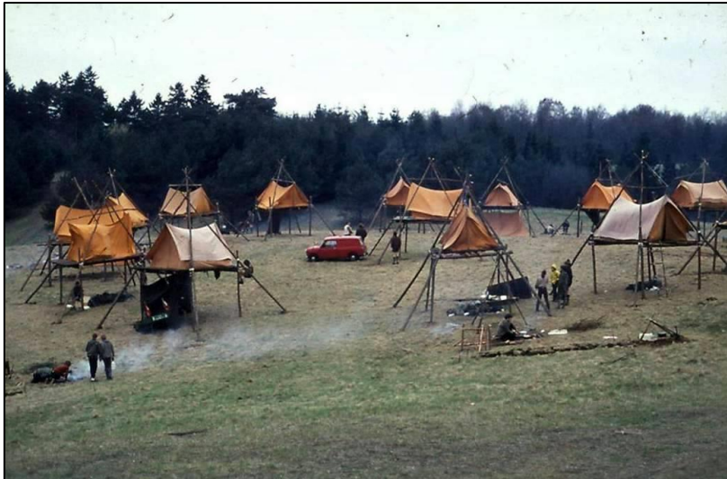
Figur 3: Forårsturnering på Egedam 1969.