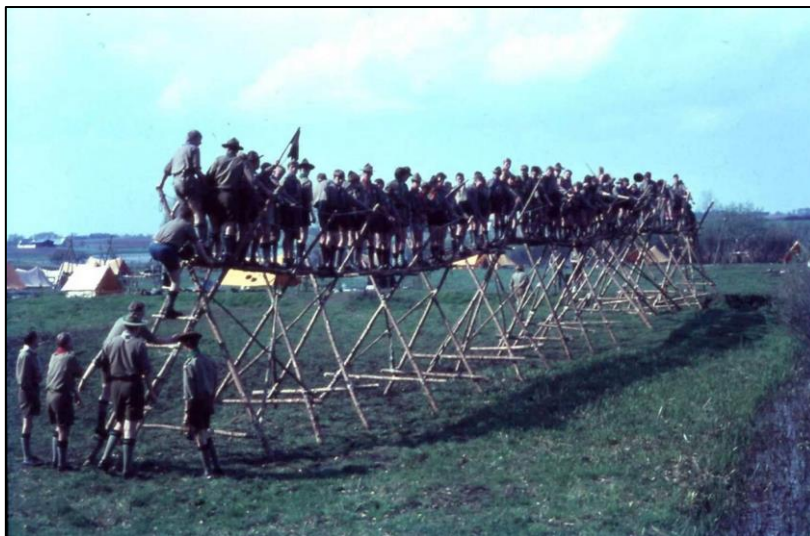
Figur 1: Forårsturnering 1966 på Nejede Vesterskov. Alle mand er på broen.

Divisionen har en lang tradition for at afholde fantasifulde forårsturneringer. Sidst i notatet er en oversigt over turneringer fra 1971 og frem. I det følgende omtales nogle sjove eksempler både før og efter sammenlægningen i 1973.