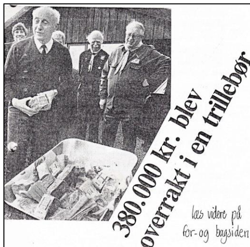
Figur 2: I 1988 betaler distriktet 380.000 kr. i en trillebør for Råbjerggrunden.

Ved distriktets nedlæggelse i 1991 blev Råbjergfonden stiftet den 10. januar og fonden fik overdraget grunden og det resterende beløb på byggefondskontoen. Fonden var tilknyttet distriktet med divisionerne Ravnsholt, Ege, Frederiksborg og Øresund.