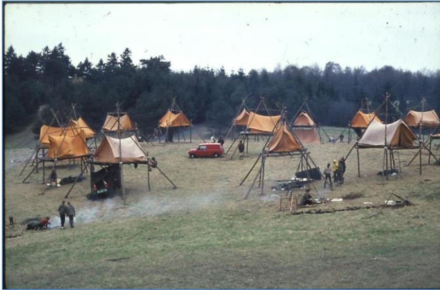
Figur 2: Forårsturnering på Egedam 1969

Ved distriktets nedlæggelse i 1991 blev Råbjergfonden stiftet den 10. januar og fonden fik overdraget grunden og det resterende beløb på byggefondskontoen. Fonden var tilknyttet distriktet med divisionerne Ravnsholt, Ege, Frederiksborg og Øresund.