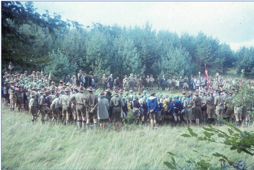
Figur 1: Divisionsparade på Egedam 30. august 1964.