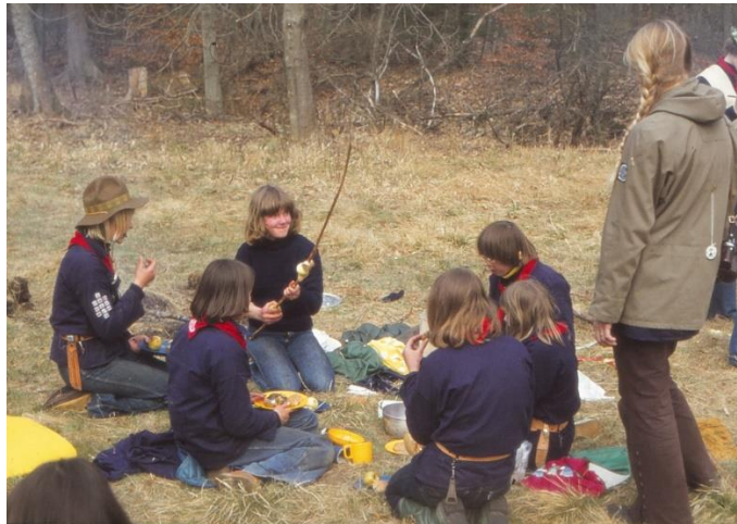
Figur 6: Forårsturnering i 1978. Spisepause på hiken..

Efter et byløb i København endte spejderne i Tuborg Havn hvorfra turen gik til Sverige, hvor resten af turen foregik på Gillastig. En del af pointsystemet var baseret på "matadorpenge", som også kunne omsættes på et casino fredag aften.