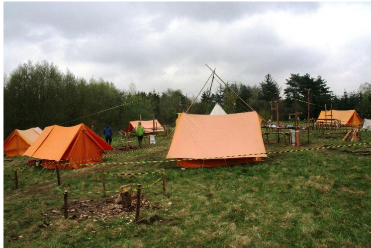
Figur 9: Forårsturnering i 2010. Base på en fremmed planet.