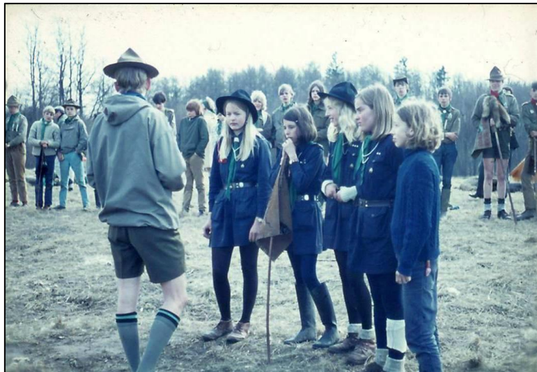
Figur 4: Forårsturnering i 1970. Divisionschefen uddeler præmier.

Patruljerne overnattede i rakettårne med platforme 2 meter over jorden. Der var elektronisk kommunikation til alle fra centalkommandoen. Få måneder før den første månelanding!