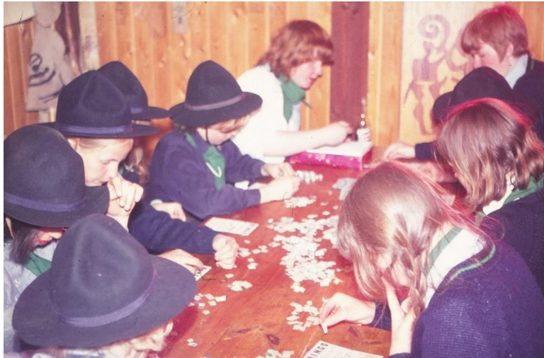
Figur 5: Forårsturnering i 1971. Bankospil på casinoet.