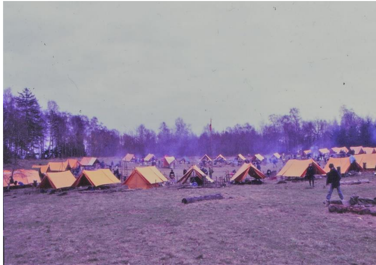
Figur 7: Forårsturnering i 1986. Lejren i rundkreds.