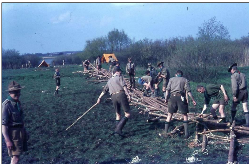
Figur 2: Forårsturnering 1966 på Nejede Vesterskov. Broen er væltet.

Det store clou var bygningen af en lang bro af A-bukke, hvor alle spejderne kunne stå. Lokalpressen var inviteret for at forevige begivenheden. Fotografen fik sit livs billede, da broen lige så stille lagde sig ned. Det var på forsiden af avisen dagen efter. Heldigvis kom ingen alvorligt til skade.