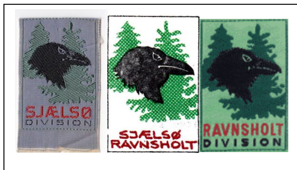
Figur 2: Divisionsmærker omkring sammenlægningen. Det fælles mærke blev kun anvendt en kort periode på divisionsbladet.

Man valgte at videreføre navnet Ravnsholt Division. Fra og med april 1972 udgav man det fælles blad "Divinyt" med et til lejligheden designet fælles bladhoved: "Sjælsø/Ravnsholt, De danske Spejderkorps" 20 . Det grønne mærke med raven blev senere det nye, fælles divisionsmærke.