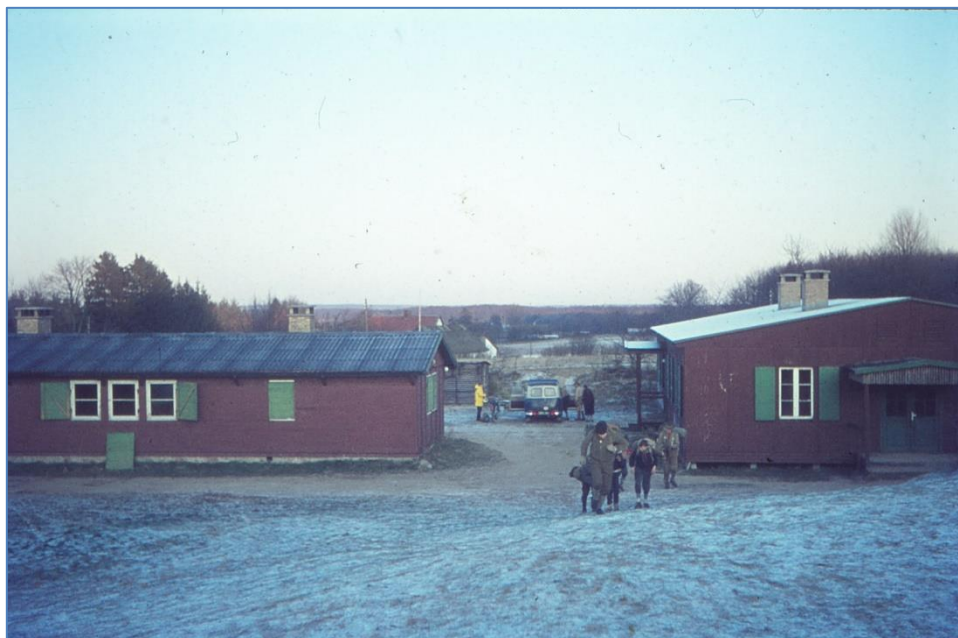
Figur 1: Egedam 15. december 1968.

Råbjerggrunden blev købt i 1987 af det nye Nordsjællands og Bornholm distrikt. Distriktet havde ved købet 1 million DKK i en byggefond. Pengene stammede fra drengesiden (Egedam) ved sammenlægningen i 1973.